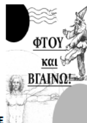
Θεατρική ομάδα ΠΤΔΕ